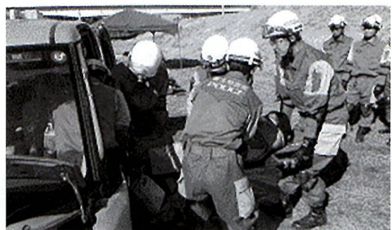
車内からの救出救助訓練